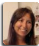
Rosa Chieco Redazione Luce e Vita

Un luminoso cammino di preparazione per accogliere la vita, per cogliere l'immensità, la profondità, la grandezza di questo dono speciale che prende dimora in una coppia.