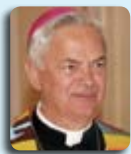
* Domenico Cornacchia Vescovo

“ Tutti i credenti stavano insieme e avevano ogni cosa in comune, vendevano le loro proprietà e stanze e le dividevano con tutti, secondo il bisogno di ciascuno” (Atti 2,44-45).