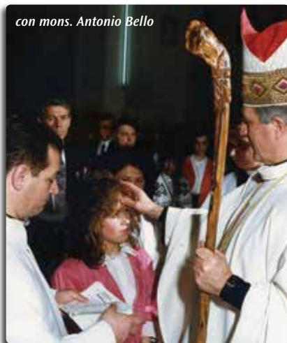
con mons. Antonio Bello

Grazie di cuore per questa liturgia umile e silenziosa della seminazione che hai celebrato non solo e non tanto nel tempio, quanto nel tempo sacro della nostra adolescenza con il tuo tatto squisito ed elegante e con la tua preparazione culturale vasta e aperta. Mistagogo per vocazione e attitudine personale, non ci hai introdotti solo nella conoscenza del mistero di Cristo, ma ci hai accompagnati con amore nell'esaltante e difficile mestiere di vivere , nella ricerca della nostra personale vocazione.»