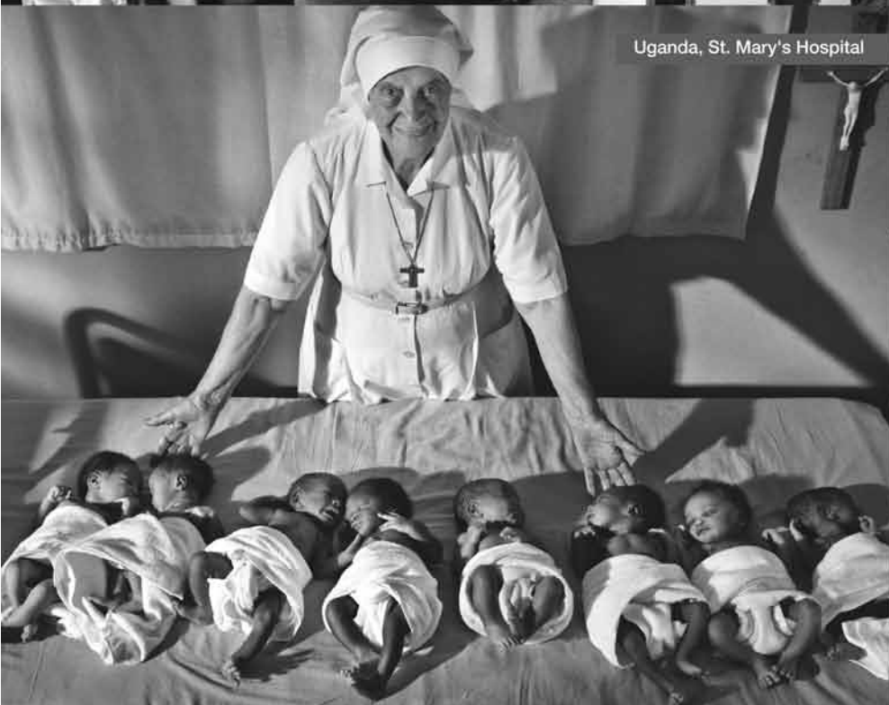
Uganda, St. Mary's Hospital