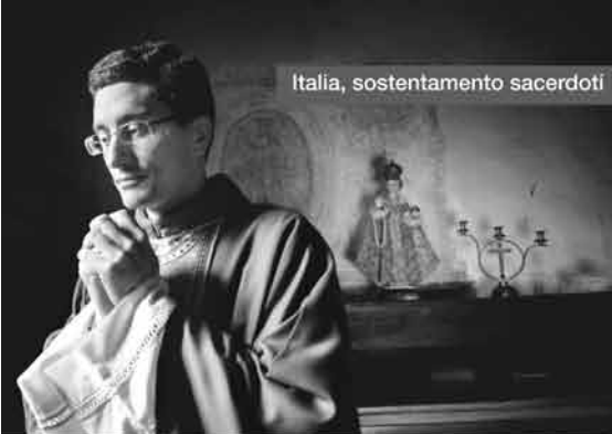
Italia, sostentamento sacerdoti