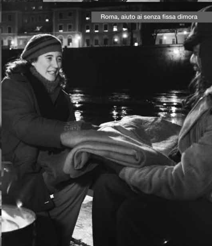
Roma, aiuto ai senza fissa dimora