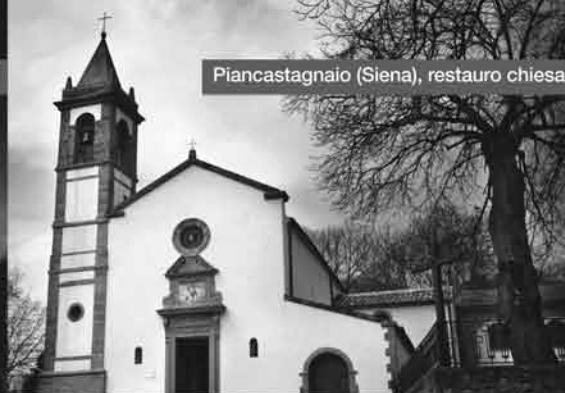
Piancastagnaio (Siena), restauro chiesa