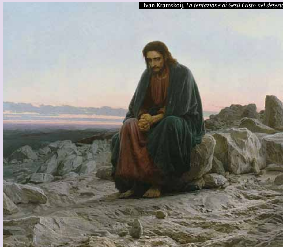
Ivan Kramskoj, La tentazione di Gesù Cristo nel deserto

È nel silenzio della preghiera che incontriamo più facilmente Dio, forse per questo è diventato difficile pregare.