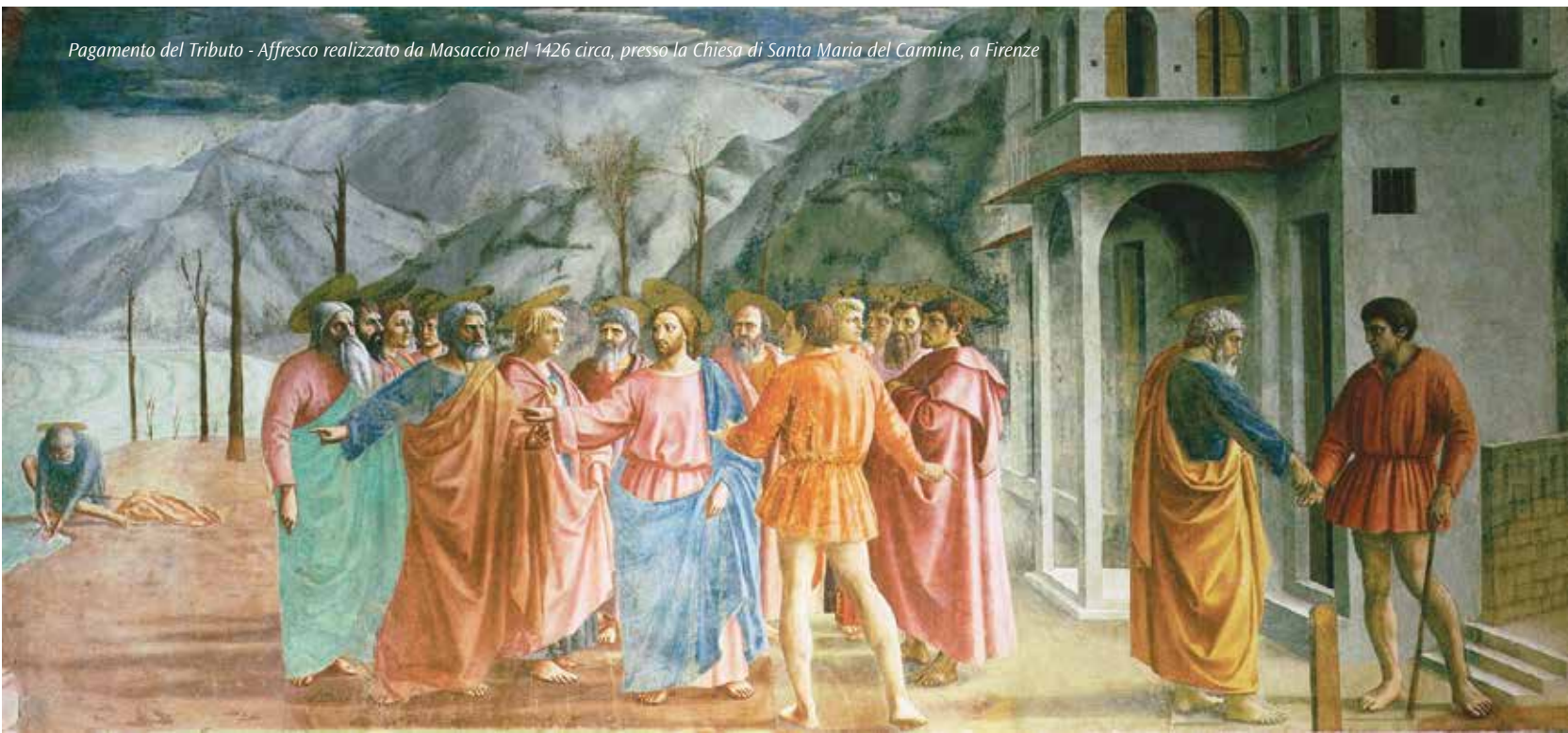
Pagamento del Tributo - Affresco realizzato da Masaccio nel 1426 circa, presso la Chiesa di Santa Maria del Carmine, a Firenze