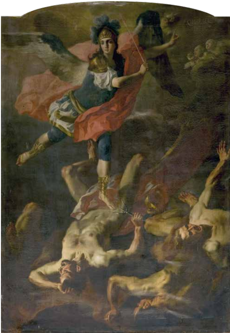
F. SOLIMENA (attr.), La cacciata degli angeli ribelli , XVIII sec. tela prima delle operazioni di restauro