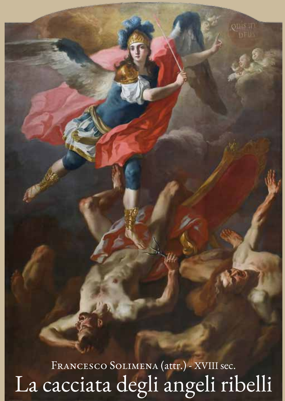
FRANCESCO SOLIMENA (attr.) - XVIII sec. La cacciata degli angeli ribelli