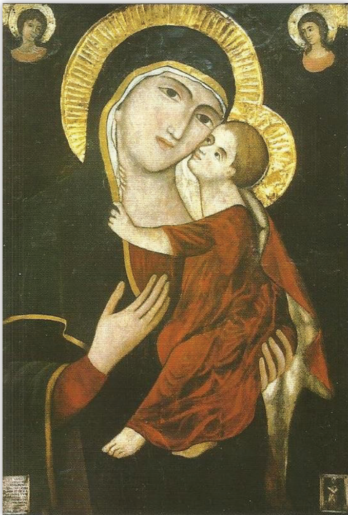
Madonna dei Martiri , Pittore meridionale, olio su tavola (XIV sec.). Basilica Santa Maria dei Martiri in Molfetta.