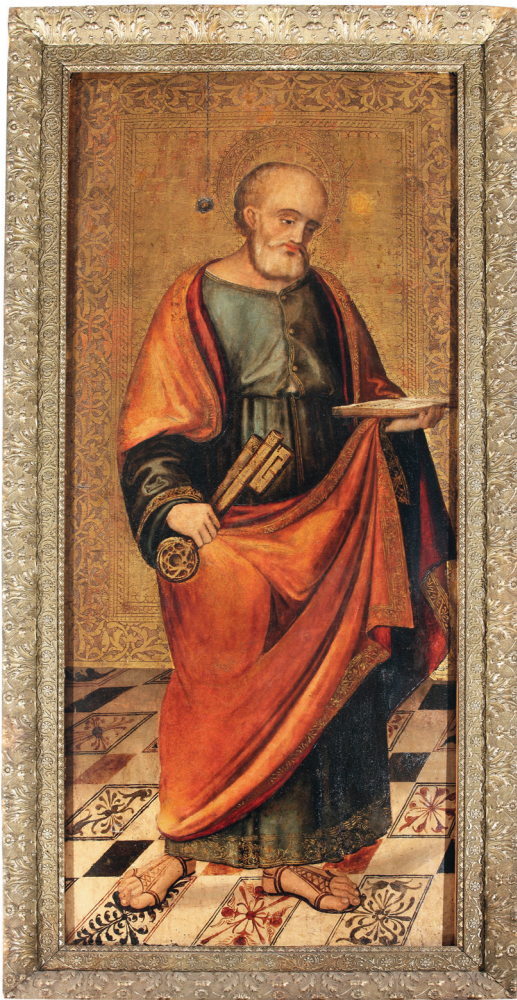
San Pietro , Pittore meridionale, olio su tavola (XVI sec.). Museo diocesano Molfetta, provenienza chiesa di S. Lucia in Terlizzi.