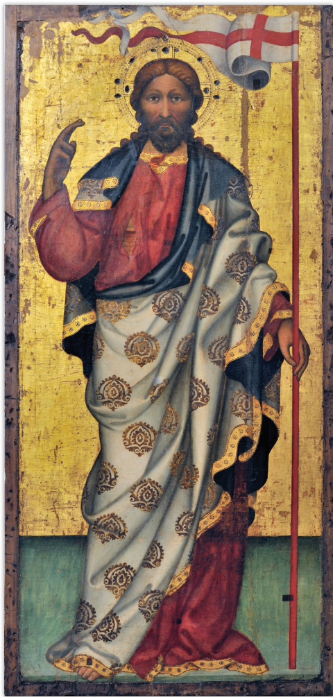
Cristo Redentore , Pittore meridionale, olio su tavola (XV sec.). Chiesa Concattedrale di Santa Maria Assunta in Giovinazzo.