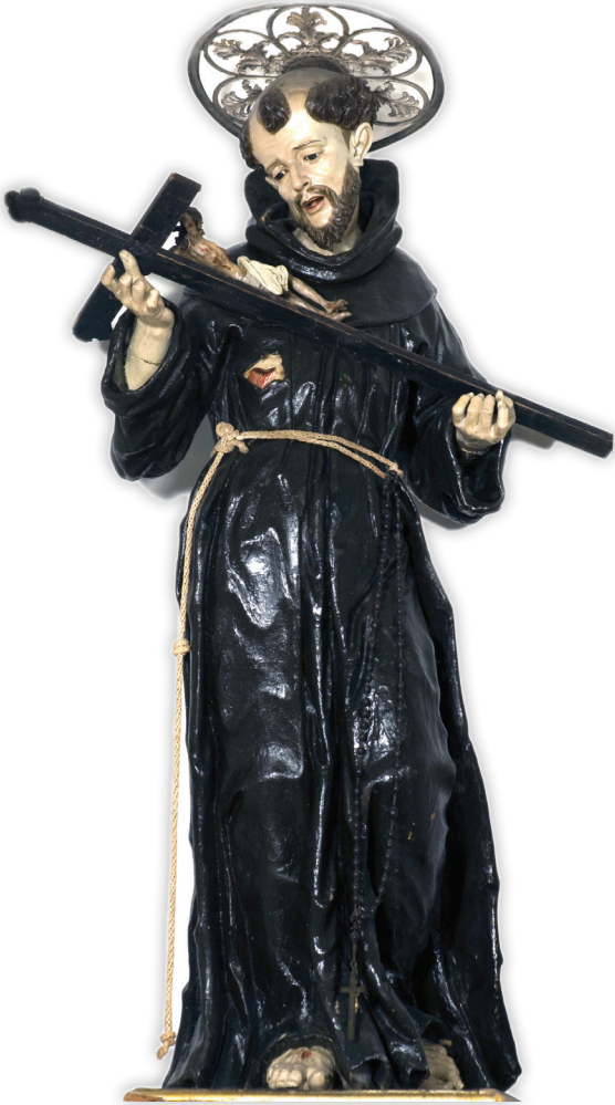
San Francesco , Scultore meridionale, legno scolpito policromo (XVIII sec.). Chiesa di San Michele Arcangelo in Ruvo di Puglia.